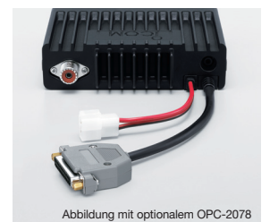
Abbildung mit optionalem OPC-2078

Zur Steuerung des NF-Ausgangs, des Modulationseingangs, zur Fernbedienung, zum Steuern eines Signalhorns und für viele weitere Funktionen stehen optionale Zubehörcable zur Verfügung. Das OPC-1939 ist die Sub-D-15-Pin-Ausführung und das OPC-2078 die 25-polige Variante des Kabels.