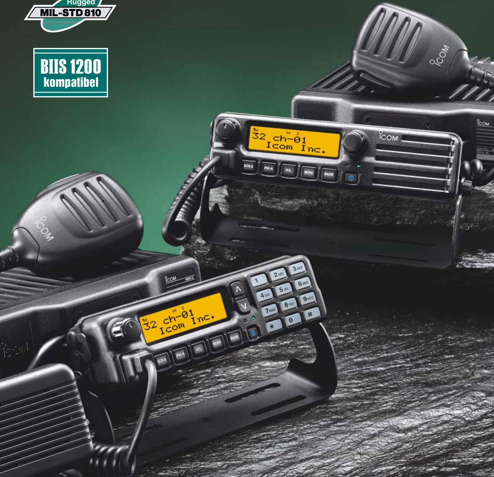
Abbildung mit optionalem Separationskit RMK-2 und Separationskabel OPC-609